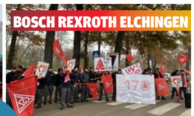
BOSCH REXROTH ELCHINGEN