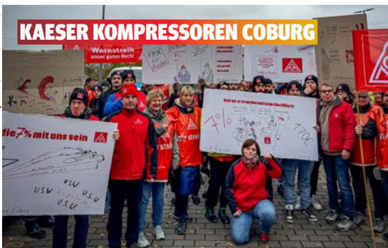
KAESER KOMPRESSOREN COBURG