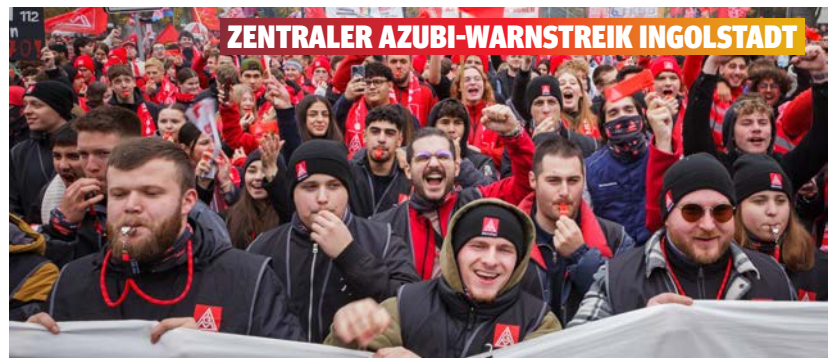
ZENTRALER AZUBI-WARNSTREIK INGOLSTADT